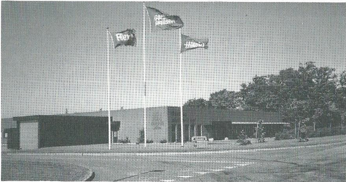
Gørding Skofabrik med den 2.200 m 2 store nye fabriksbygning fra 1978 på Ålunden. Senere er fabrikken udvidet med yderligere 1.000 m 2 . I alt er der 75 ansatte.

den om at kunne overtage lokaler andre steder i landet. Men kommunen gik ind i arbejdet på at sikre fabrikkens fortsatte virke, og mens der blev fremstillet sko i lejede lokaler i Bramming, blev en helt ny fabrik på 2.200 kvm. opført på Ålunden i Gørding. I stedet købte kommunen grunden og stumperne af den gamle virksomhed, men senere generhvervede Gørding Skofabrik det for at bruge hallen som eksportlager. I 1985 blev der imidlertid udvidet med 1.000 kvm. til råvare- og eksportlager på Ålunden, så fabrikken igen blev samlet på et sted, og hallen på Industrivej blev solgt til naboen Dana Kontormiljø.