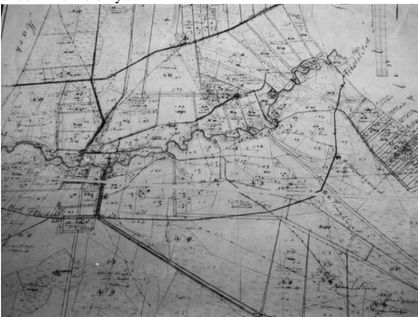
Gl. mat. kort fra 1794 med gl. vejforløb.