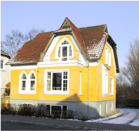
Huset Nørregade 51 i Gørding.