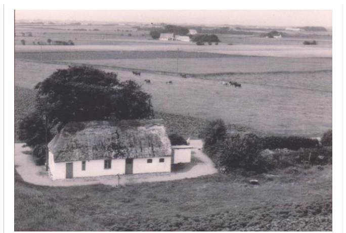
Huset på Stårupvej 1. ca.1950