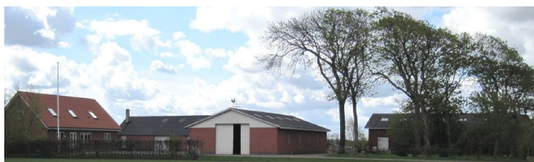
Fonagervej nr.7. maj 2010