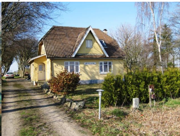
Mosevang ca. 1950. (bemærk hønsehuse t.v.)