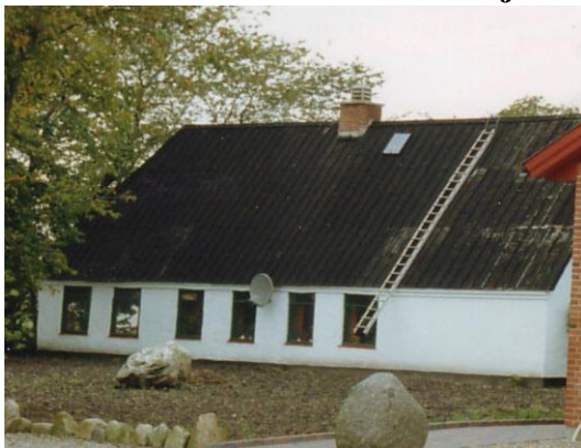
Fonagervej nr. 5 med det gl. stuehus