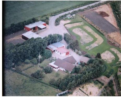
Fonagervej nr. 4. 1998

Hele matriklen nr. 19a ejes omkring år 1800 af Gørdinglund og var på ca.10 ha. men bliver senere opdelt i 5 parceller, hvoraf 19e er en af dem. Se Matrikelkortet tv. som går fra 1800 til 1860