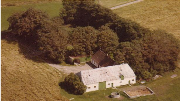
Fonagervej nr. 2. ca. 1955