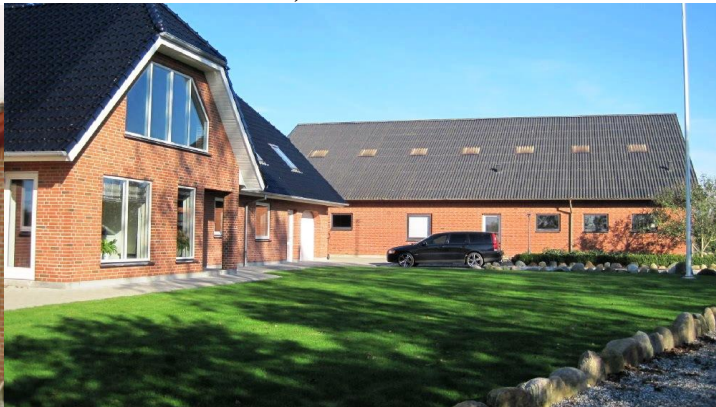
Den nye gård 2010

Ejendommen er udstykket fra "Annesminde" Annesmindevej nr. 1 1862