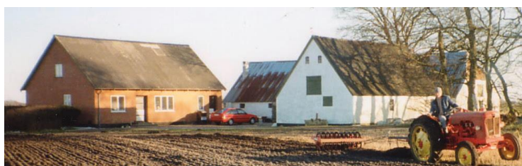
Fonagervej nr. 7. 1996